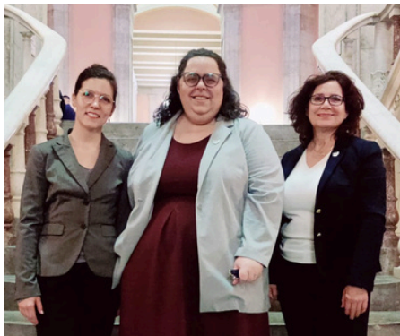
COWC después de que se convirtiera en ley el HB 106

Talones de Pago – El Proyecto de Ley 106 (HB 106), la Ley de Protección de Talones de Pago, exige que los empleadores de Ohio proporcionen talones de pago a sus empleados. El COWC y Policy Matters Ohio apoyaron y testificaron a favor del HB 106. La legislatura de Ohio aprobó el HB 106 el 18 de diciembre de 2024 y el gobernador lo firmó el 8 de enero de 2025. Esta nueva ley entra en vigor el 9 de abril de 2025. El COWC y Policy Matters Ohio enviaron una carta al Director del Departamento de Comercio de Ohio solicitando información sobre cómo el Departamento aplicará la Ley de Protección de Talones de Pago y ofrecieron colaborar con el Departamento en la implementación de la nueva ley.