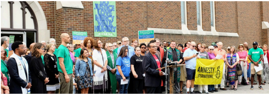
REUNIÓN DE SANTUARIO - COWC

Proyecto de ley anti-santuario: el nuevo Proyecto de ley de la Cámara de Representantes n.º 26 requeriría que los gobiernos estatales y locales cooperen con el gobierno federal y activaría reducciones de fondos en caso de incumplimiento.