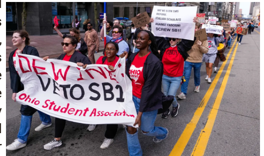
LA ASOCIACIÓN DE ESTUDIANTES DE OHIO ENCABEZA LA MARCHA HACIA EL CAPITOLIO ESTATAL DE OHIO PARA PROTESTAR CONTRA EL PROYECTO DE LEY 1 DEL SENADO EL MIÉRCOLES 19 DE MARZO DE 2025 EN COLUMBUS, OHIO.

Proyecto de Ley de Educación Superior: El Proyecto de Ley 1 del Senado y el Proyecto de Ley 6 de la Cámara de Representantes (aplicable a todas las universidades públicas de Ohio) prohibirían todas las oficinas, cursos, capacitaciones, orientaciones y becas de diversidad e inclusión; prohibirían las huelgas del profesorado universitario; prohibirían la negociación colectiva sobre las evaluaciones del profesorado universitario y la negociación de políticas de revisión posterior a la titularidad; exigirían la revisión posterior a la titularidad y evaluaciones anuales del desempeño del profesorado; y prohibirían el adoctrinamiento de estudiantes sobre cualquier creencia controvertida. Tras ser aprobado por la Cámara de Representantes el 20 de marzo y por el Senado el 12 de febrero de 2025, es probable que el proyecto de ley vuelva a ser aprobado por el Senado y sea promulgado por el gobernador Mike DeWine. Estos aprobaciones llegan a pesar del abrumador testimonio de los oponentes, así como de las protestas de los estudiantes, profesores, personal y miembros de la comunidad de la Universidad.