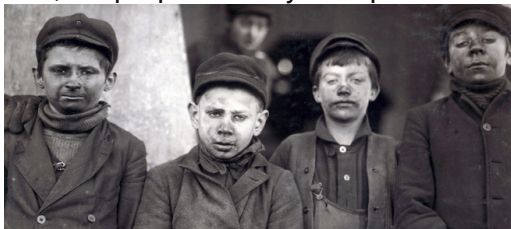
NIÑOS EN MINAS DE CARBÓN DE PENNSILVANIA.

Protesta Política – El nuevo Proyecto de Ley Senatorial 53 responsabilizaría a las organizaciones en demandas civiles por lesiones o pérdidas a personas o bienes debido a vandalismo o disturbios. También fomentaría el procesamiento penal de los manifestantes que cometan tales actos. El Comité Judicial del Senado ha escuchado el testimonio de los patrocinadores.