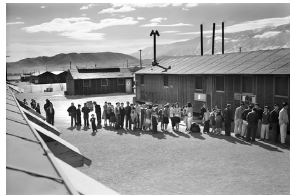
ESTADOUNIDENSES DE ORIGEN JAPONÉS HACIENDO FILA EN EL CENTRO DE REUBICACIÓN DE MANZANAR EN CALIFORNIA EN 1943.

La administración Trump está utilizando una ley muy antigua, la Ley de Enemigos Extranjeros de 1798, para deportar a algunos inmigrantes indocumentados, a pesar de que dicha ley fue concebida para usarse en tiempos de guerra.